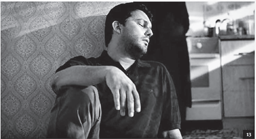
کارگردان: شهرام شاه حسینی. نویسنده: پرویز شهبازی. بازیگران: حامد بهداد، باران کوثری، پگاه آهنگرانی، رعنا آزادی‌ور، بابک کریمی، بهناز جعفری، محمدرضا هدایتی، نسیم ادبی، رویا تیموریان.

از همان روزهای پیش از جشنواره که نام «خانه دختر» در فهرست ده فیلمی قرار گرفت که تلویزیون خبری انگلستان به تماشا می‌آورد، توجه‌ها به این فیلم جلب شد.